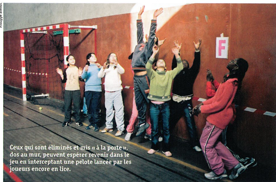
Ceux qui sont éliminés et mis « à la porte », dos au mur, peuvent espérer revenir dans le jeu en interceptant une pelote lancée par les joueurs encore en lice.

Attention : le joueur le mieux placé est obligé de jouer la balle.